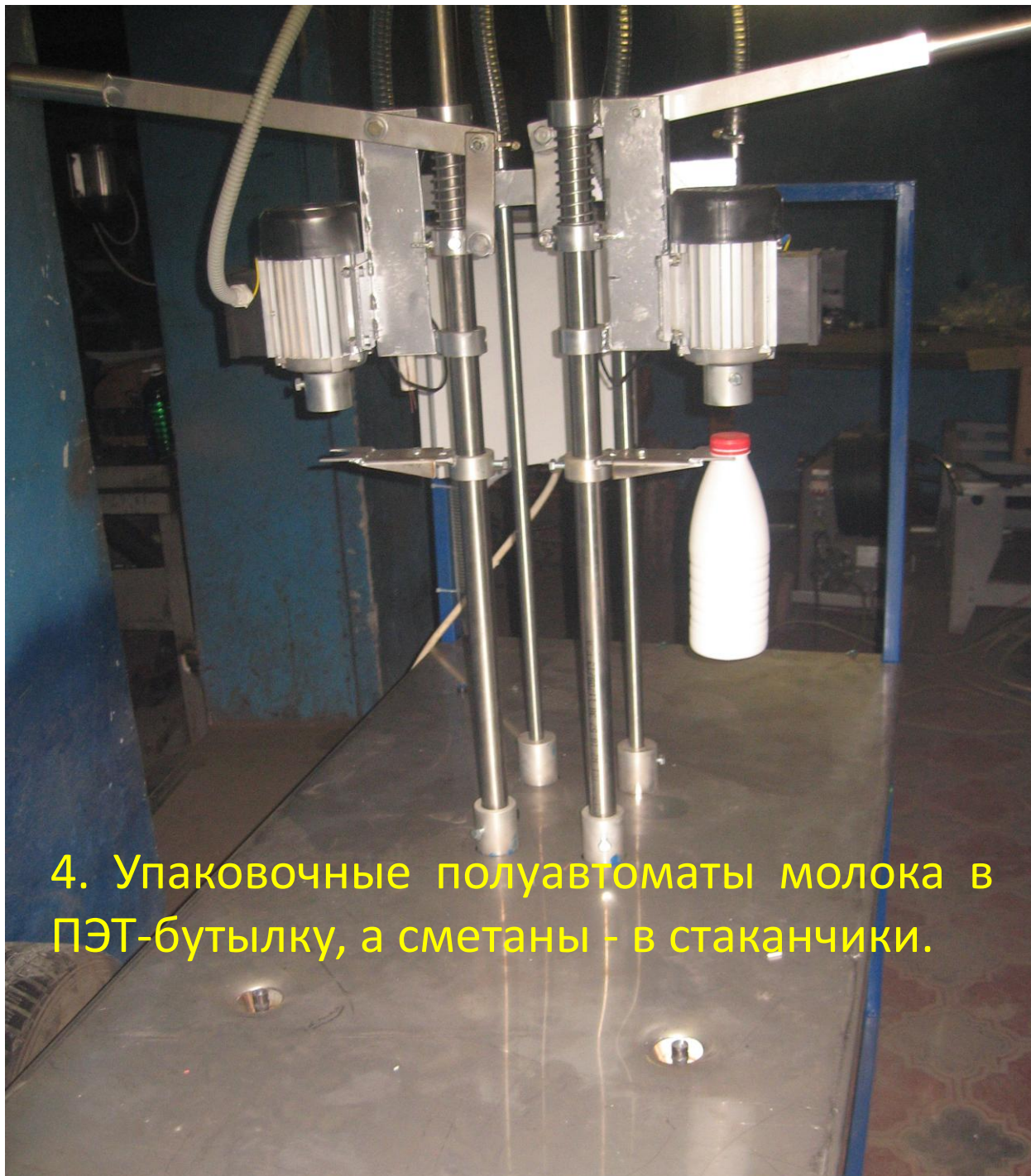
4. Упаковочные полуавтоматы молока в ПЭТ-бутылку, а сметаны - в стаканчики.